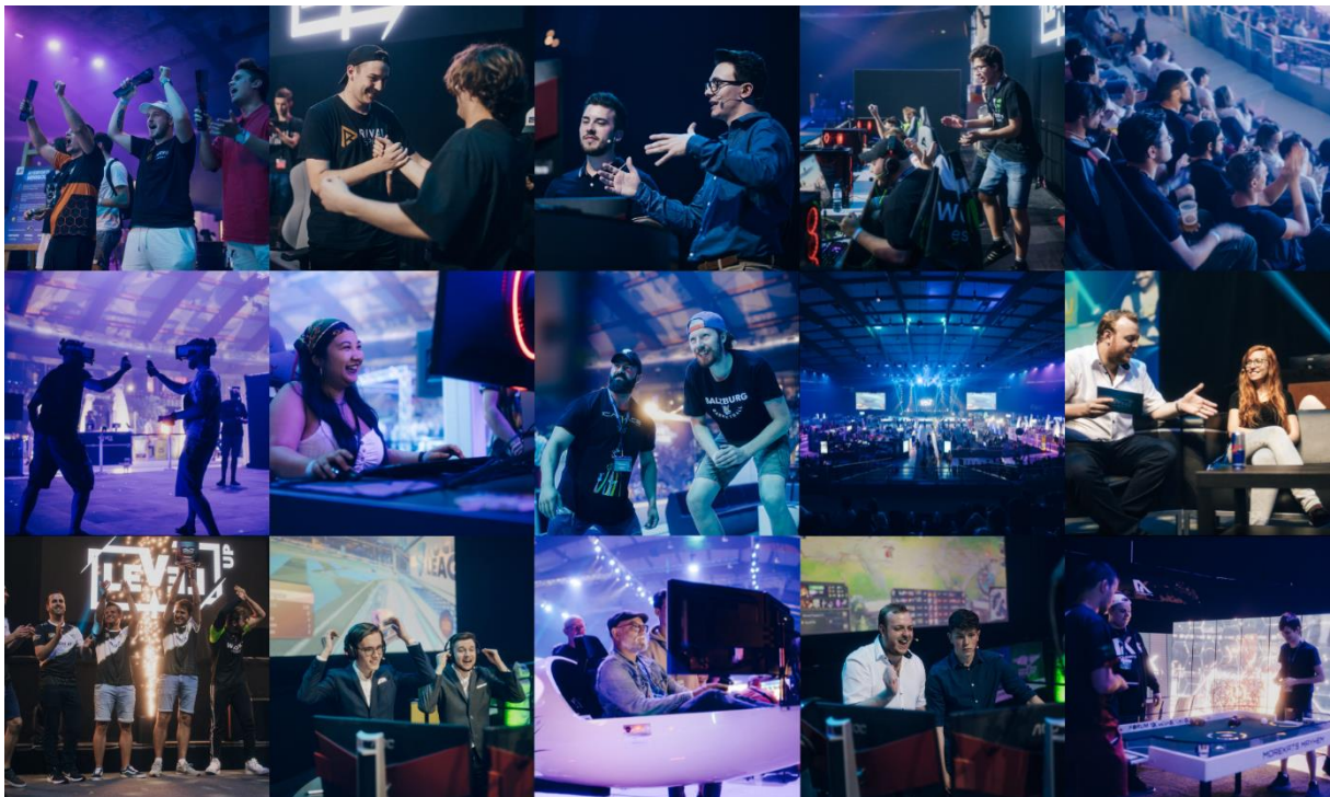
LEVEL UP bringt Besucher zusammen, um gemeinsam die Leidenschaft des Gaming in allen Facetten zu feiern.

Non-fungible Tokens, kurz NFTs sind digitale, einzigartige Items, bei denen das Echtheitszertifikat durch die technische Umsetzung auf der Blockchain bereits eingebaut ist. Im Falle der LEVEL UP NFTs reden wir hier von digitaler Kunst mit Zertifikat. Aber die LEVEL UP NFTs können noch mehr.