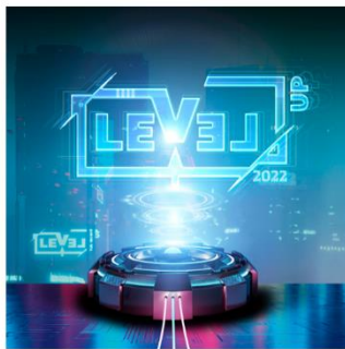
Normal 300 Stück / 60%