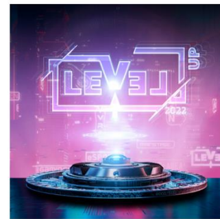
Legendär 50 Stück / 10%

Die Genesis-Edition der LEVEL UP NFT-Kollektion: Sammlerstücke mit realem Wert für treue Besucher